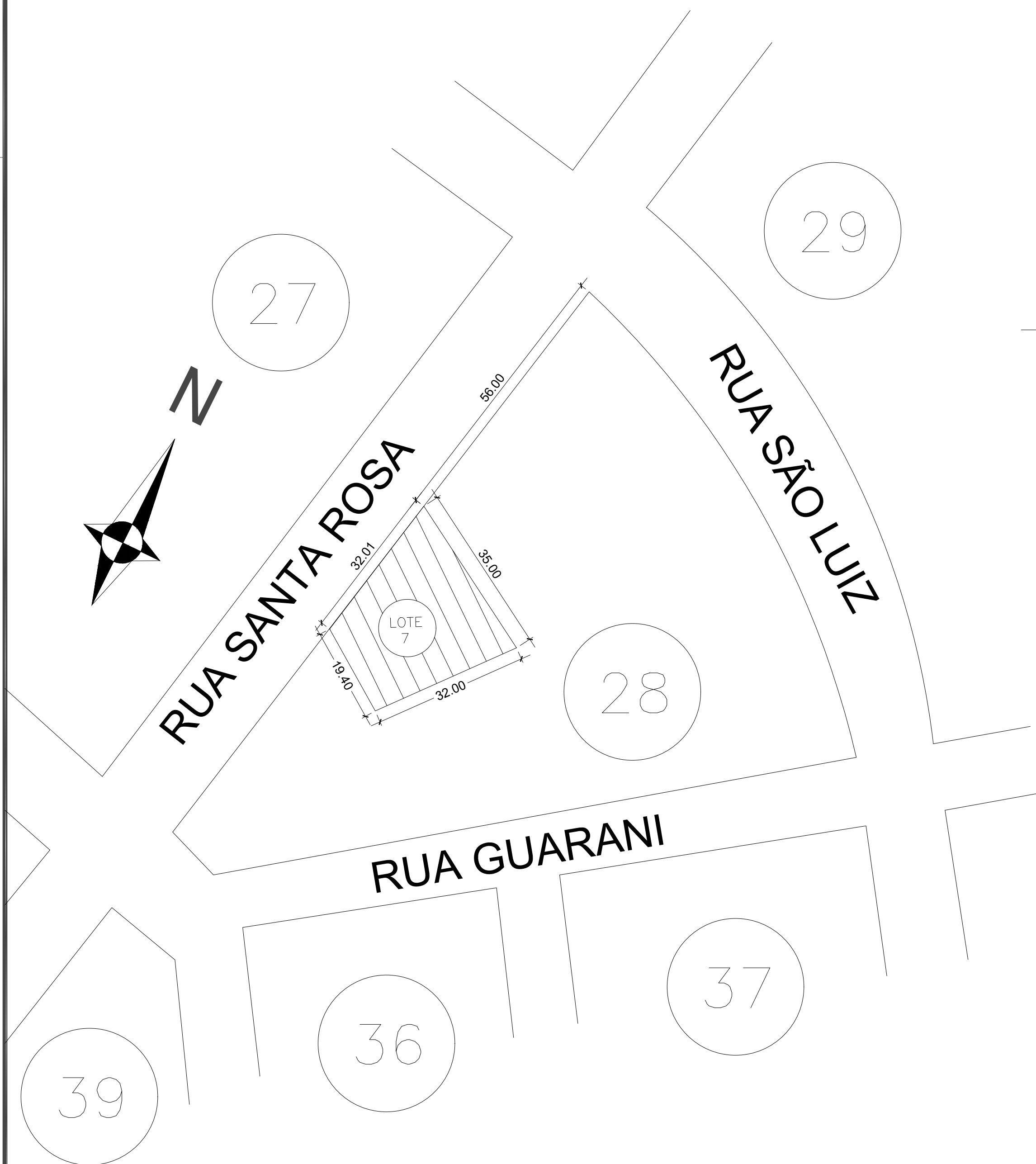
Planta de Situação- Esc 1:1000